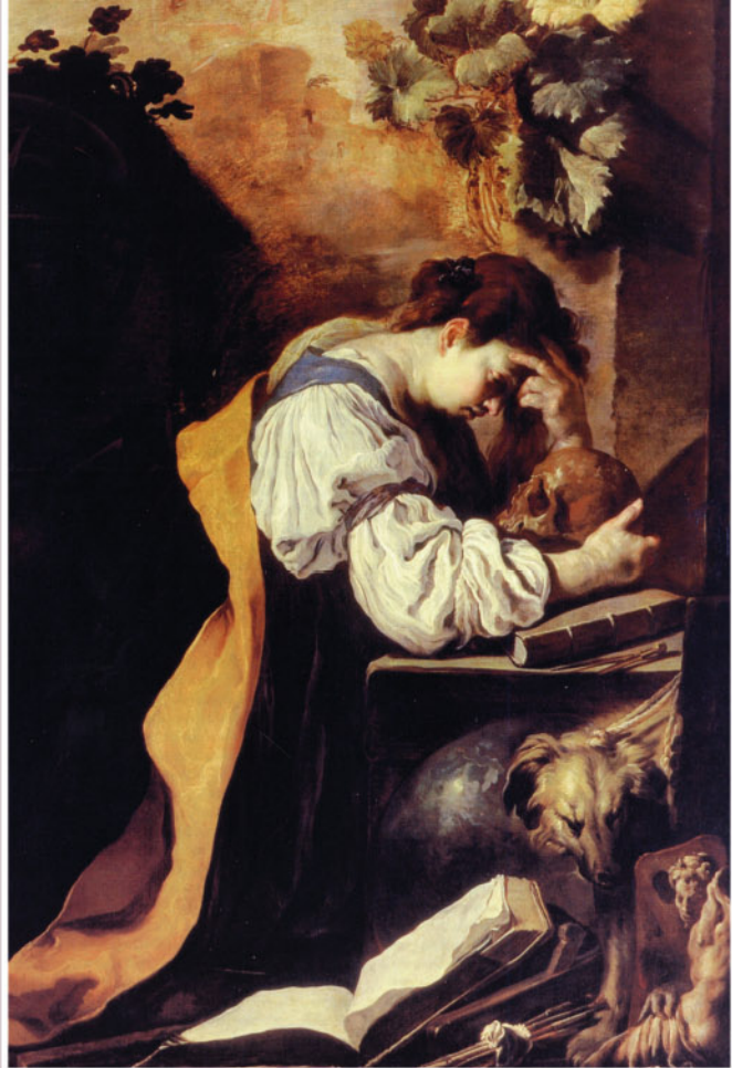
Melancholy - Domenico Fetti c. 1620